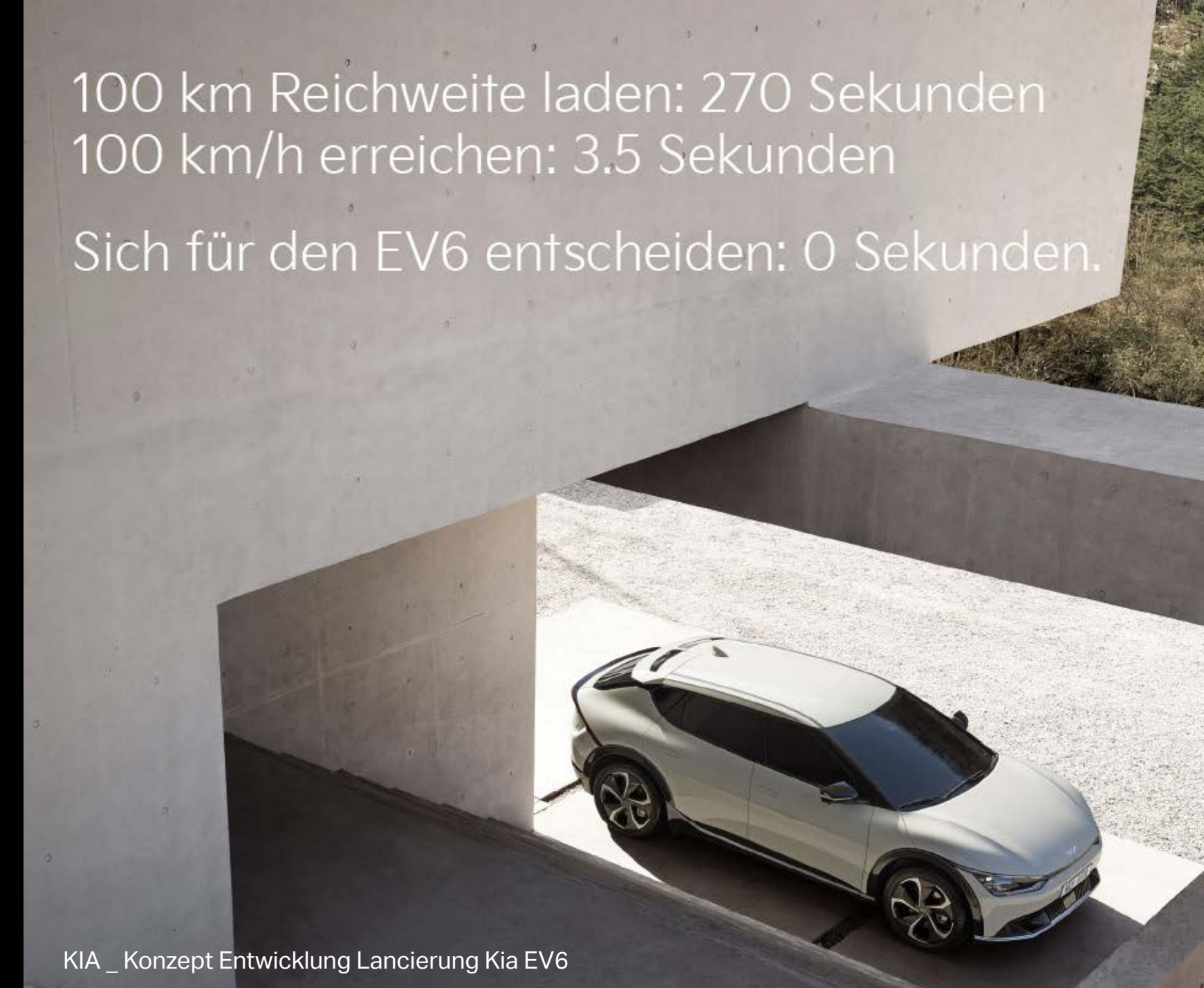
KIA _ Konzept Entwicklung Lancierung Kia EV6