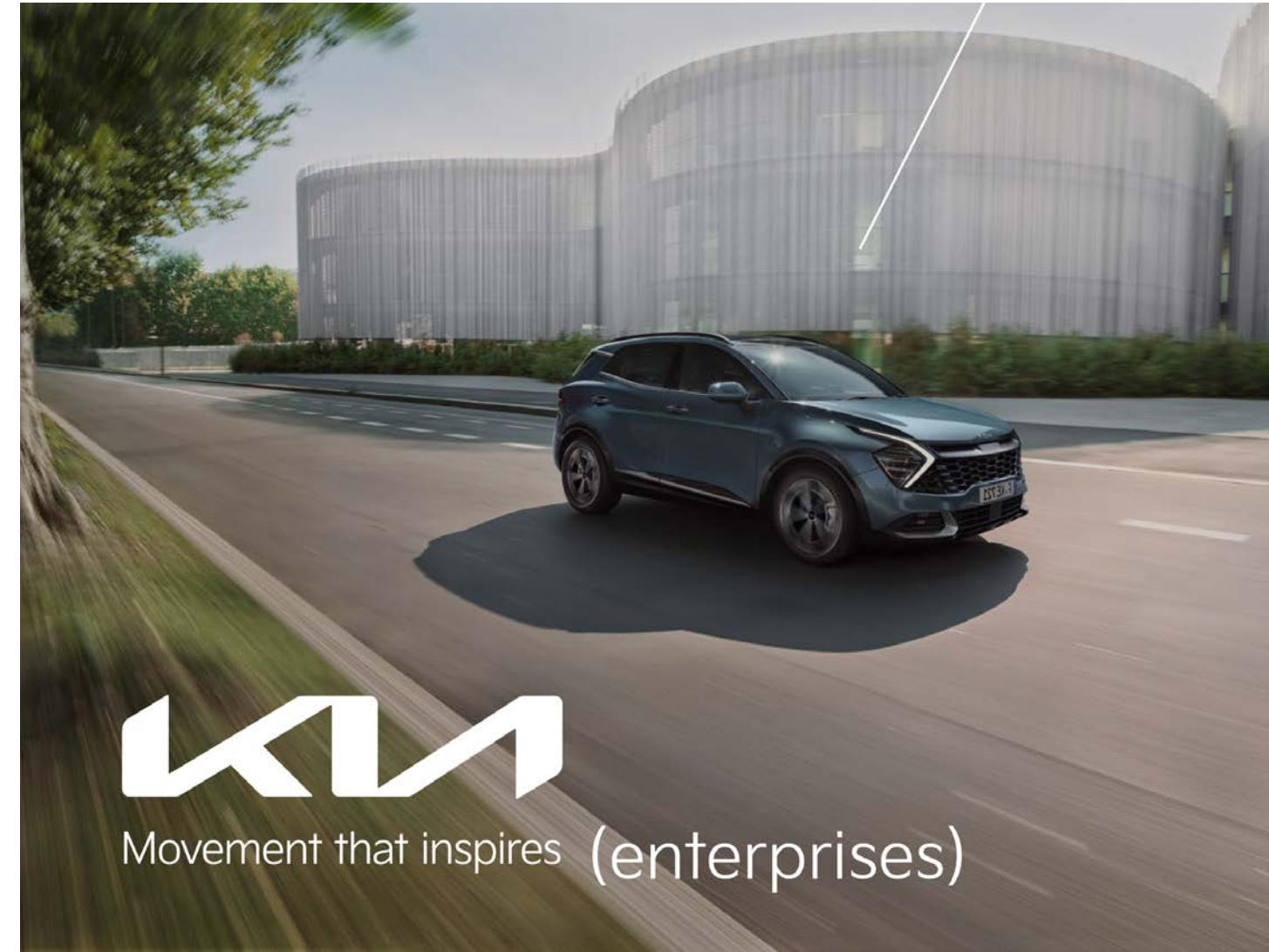
KIA _ Konzept Kia Flotten Management