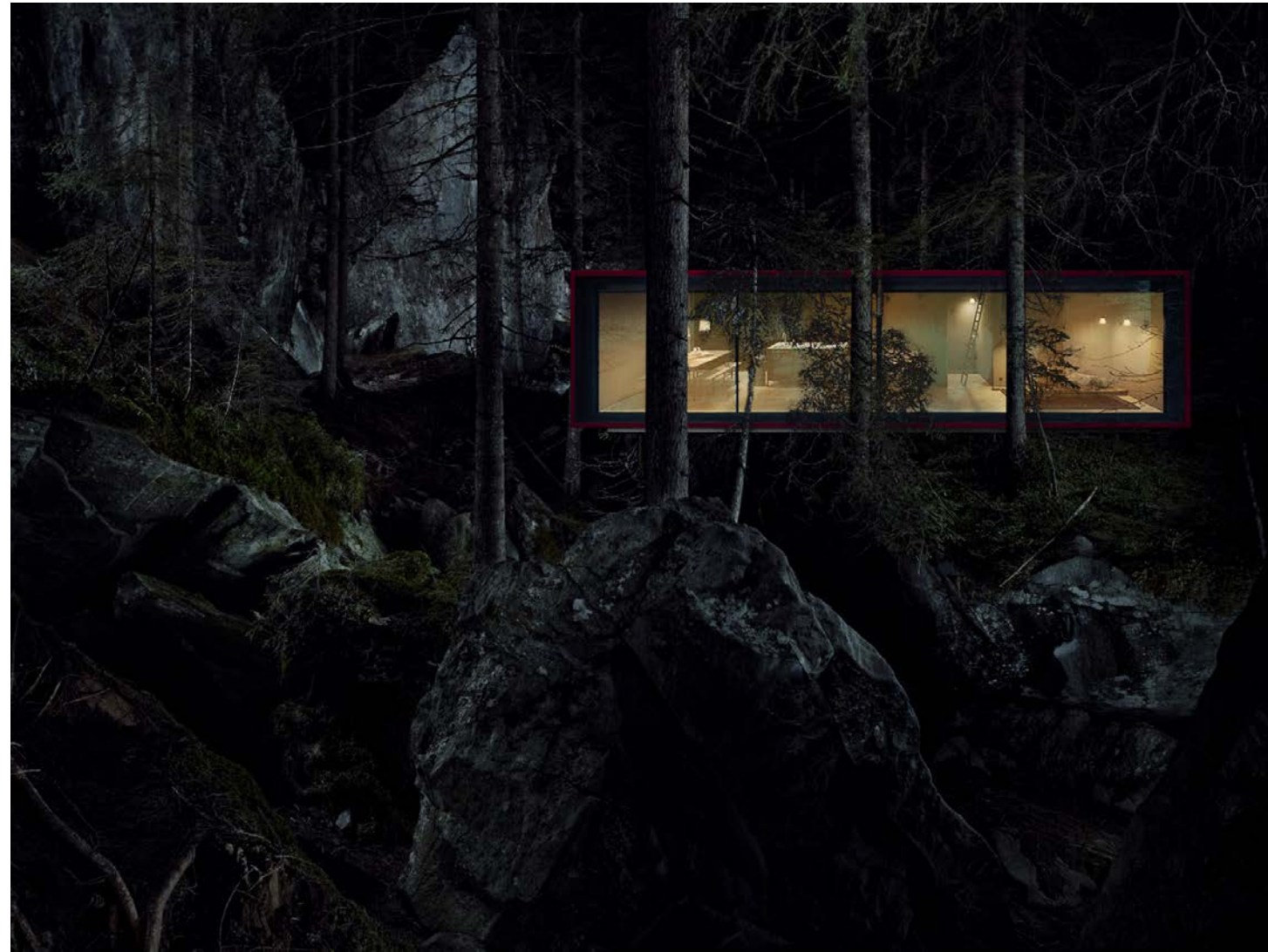
Mazda _ Entwicklung Event-Konzept