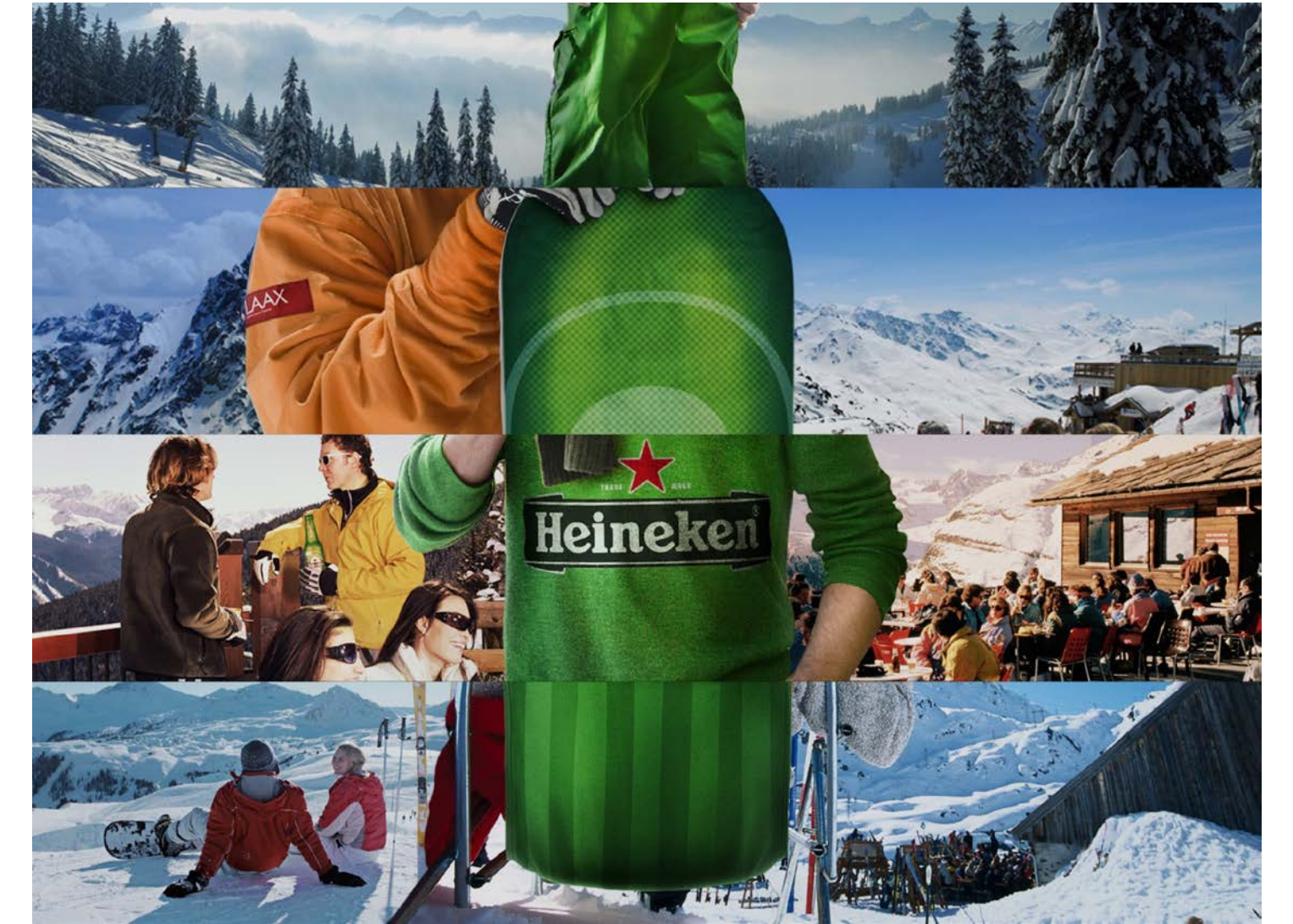
Heineken _ Konzept Produkt-Kampagne