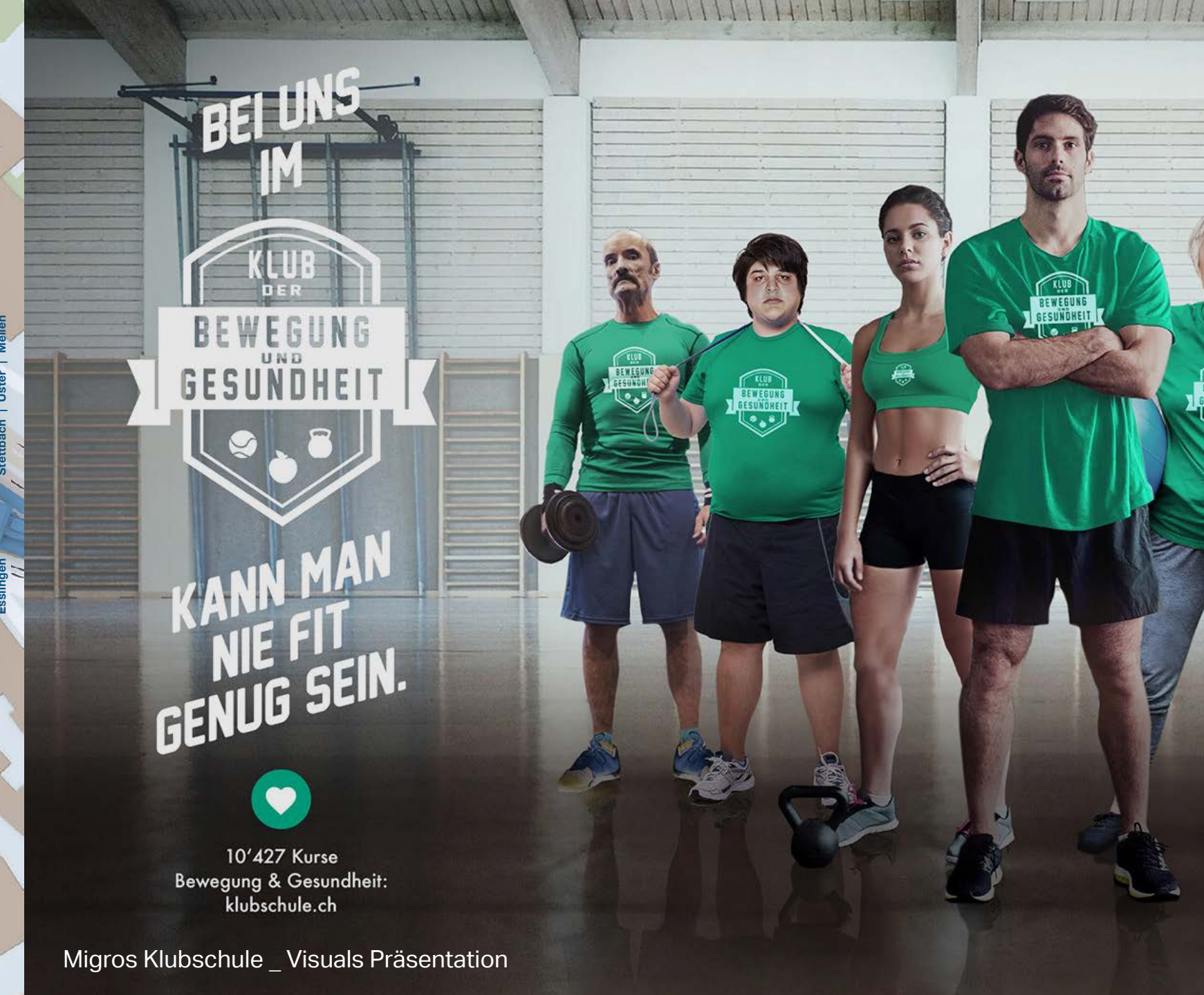
Migros Klubschule _ Visuals Präsentation

100 km Reichweite laden: 270 Sekunden 100 km/h erreichen: 3.5 Sekunden Sich für den EV6 entscheiden: 0 Sekunden.