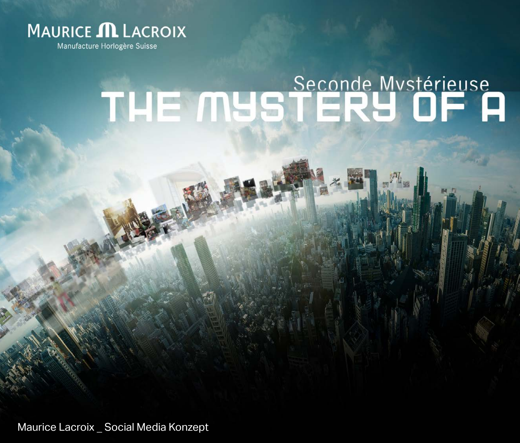
Maurice Lacroix _ Social Media Konzept