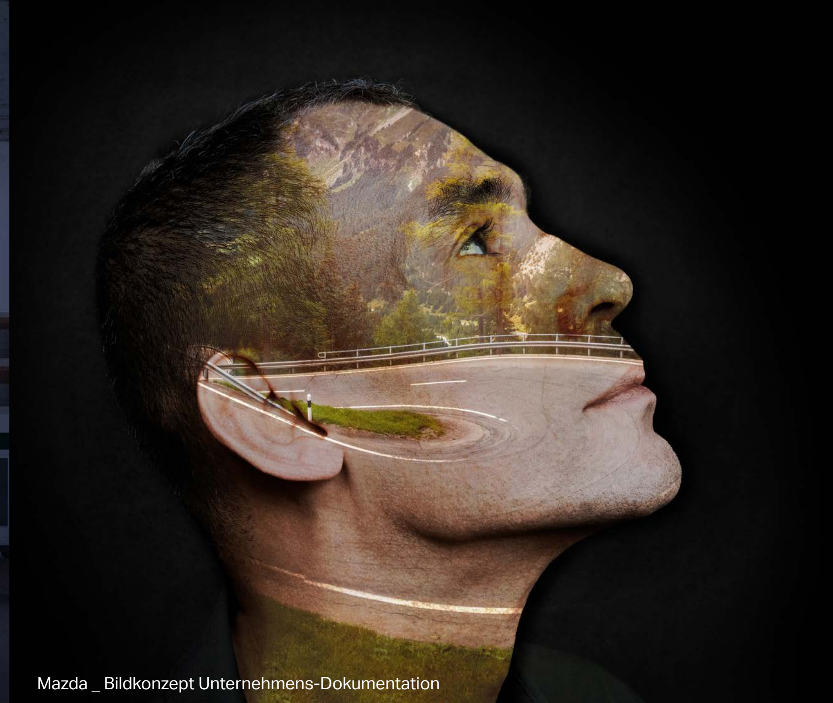
Mazda _ Bildkonzept Unternehmens-Dokumentation