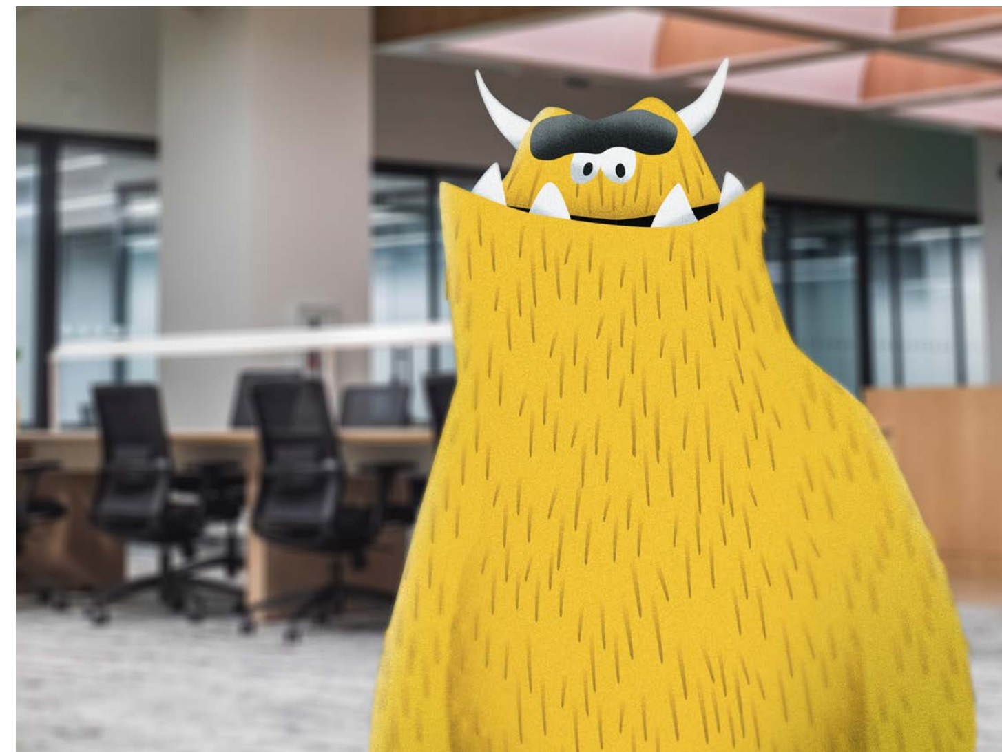
Postfinance _ Entwicklung, Illustration, Animation Störfigur