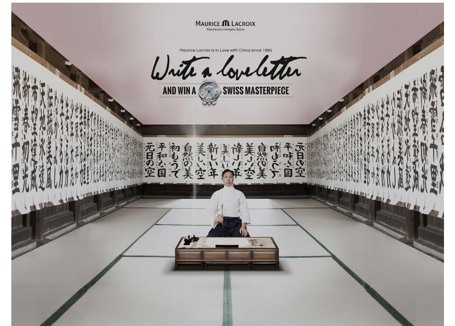
Maurice Lacroix _ Social Media Konzept Markt CHN